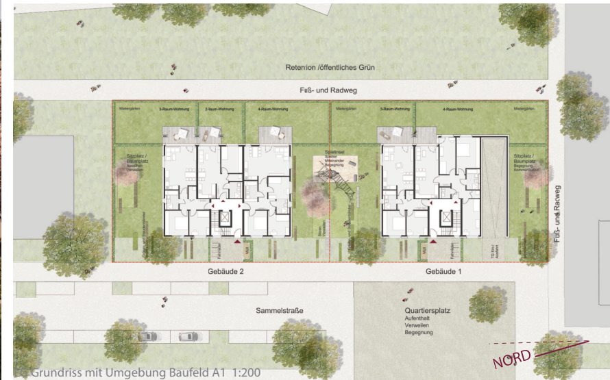
Grundriss mit Umgebung Baufeld A1 1:200