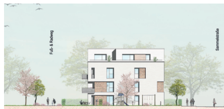
Ansicht Süd Baufeld A1 Gebäude 2 1:200