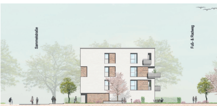
Ansicht Nord Baufeld A1 Gebäude 1 1:200