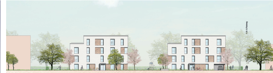
Ansicht Ost Baufeld A1 1:200