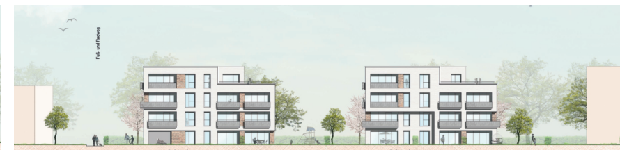
Ansicht West Baufeld A1 1:200