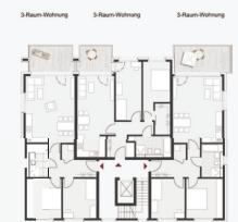
Grundriss A1 Gebäude 1 1:200