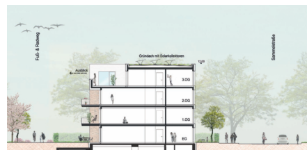
Schnitt Ost-West 1:200