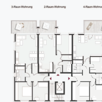
Grundriss A1 Gebäude 2 1:200