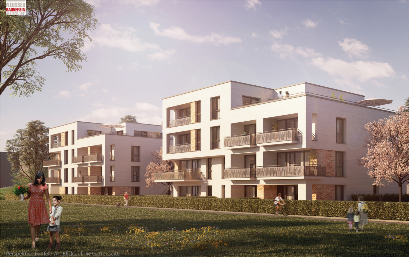
Perspektive Baufeld A1, Blick auf die Gartenseite