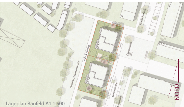
Lageplan Baufeld A1 1:500